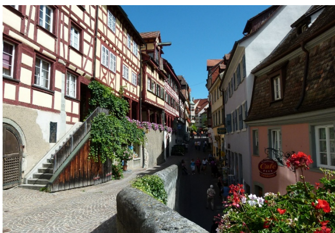
Meersburg CC0 Pixabay

Dann heißt es Abschied nehmen vom malerischen Bodensee. Transfer zum Flughafen Zürich und Rückflug mit Swiss nach Düsseldorf.