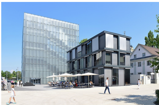
Kunsthhaus Bregenz

Anschließend individuelle Mittagspause oben auf dem Berg oder in der Stadt und Zeit zur freien Verfügung. Zahlreiche Cafés und Restaurants laden zum Verweilen ein.