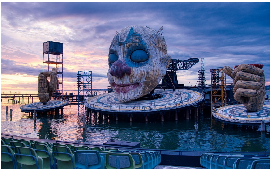
Seebühne Bregenz, Bühnenbild der Aufführung Rigoletto 2019

Der Bodensee bietet eine perfekte Mischung aus Kunst, Kultur und landschaftlicher Schönheit. Sie entdecken das charmante Lindau mit seiner malerischen Inselform, das historische Zentrum von Konstanz mit dem lebendigen Hafenviertel sowie das romantische Meersburg mit seiner mittelalterlichen Altstadt.