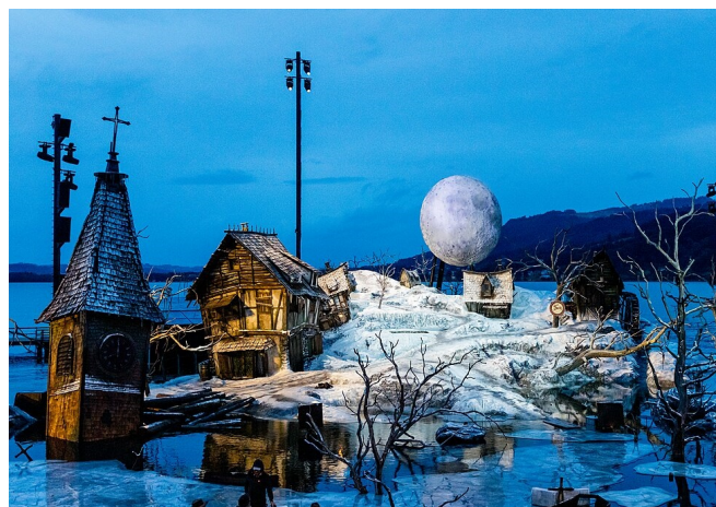
Seebühne Bregenz, Bühnenbild der Aufführung „Der Freischütz“ 2024

Am frühen Abend bringt Sie der Bus von Ihrem Hotel zum Festspielgelände. Im Gourmetzelt vor der Seebühne werden Sie zu einem exklusiven Abendessen erwartet.